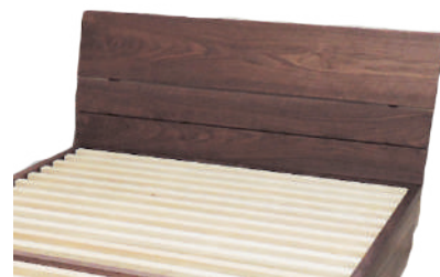
● オリジナル ウォールナット材