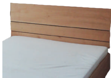
● オリジナル ヤマザクラ材