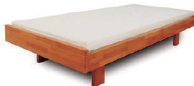
● コーチベッドフレーム(ヒュスラー) /ヘッドボードなし