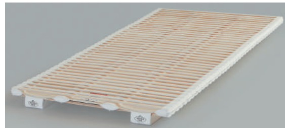
リフォーマエメント、2重の板バネが体を支えます